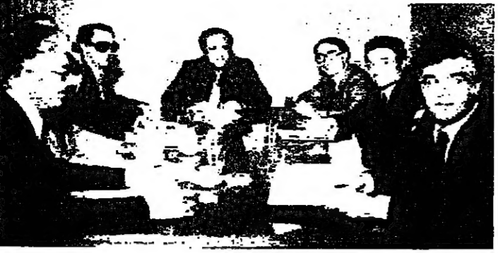
الرئيس الأسد يترأس الاجتماع ويخوله الوزيران البيروني وشيخو وعدد من الخبراء المعينين

لم يوضع موضع التنفيذ كليا بسبب الأوضاع الاقتصادية والسياسية التي يمر بها لبنان، وقد تم تأجيل المشروع عدة مرات. الرئيس الأسد يترأس الاجتماع ويخوله الوزيران البيروني وشيخو وعدد من الخبراء المعينين.